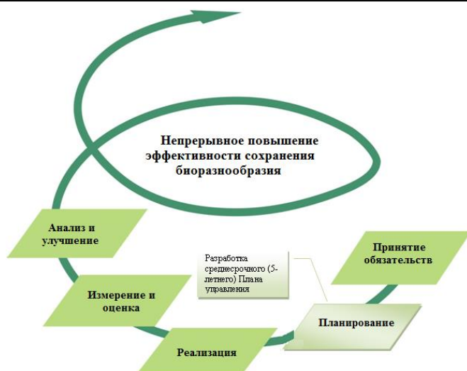
Рис. 1. Алгоритм управления и планирование деятельности ФГБУ ООПТ По: Фоменко и др., 2002.

деятельность и развитие познавательного туризма); сформировать оптимальную систему мониторинга экосистем и объектов биоразнообразия, а также деятельности ФГБУ ООПТ; оптимизировать инфраструктурное и информационно-аналитическое обеспечение с позиции установленных целей стратегического развития ООПТ; планировать формирование финансовой и материальной базы сохранения биоразнообразия и содержания ООПТ, обеспечивать рациональное и эффективное использование бюджетных средств; повысить социально-экономические выгоды от существования и сохранения ООПТ, тем самым создавая предпосылки ее успешной интеграции в контекст социально-экономического развития на основе подходов устойчивого развития.